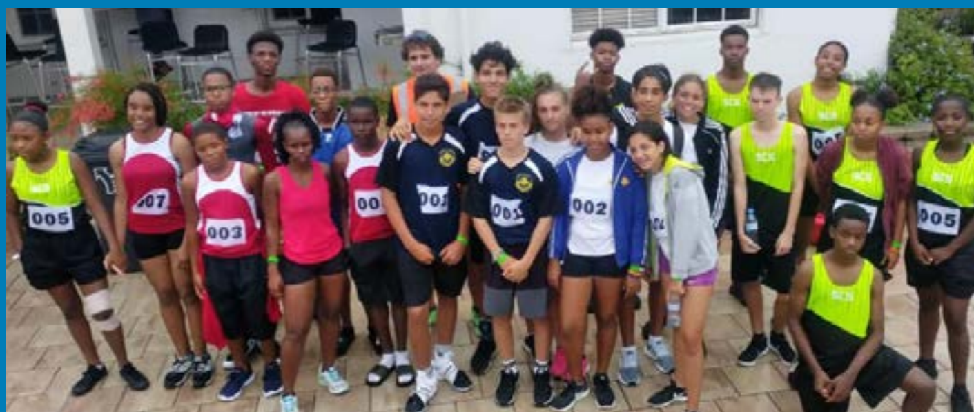
Deelnemers van Saba.

Meer dan 100 leerlingen uit Sint Maarten, Saba en Sint Eustatius namen het in het lange hemelvaartweekend tegen elkaar op tijdens de eerste editie van de Inter Island Sports Competition op Saba, georganiseerd door de Saba Comprehensive School, de Saba Sports Federation en het openbaar lichaam Saba.